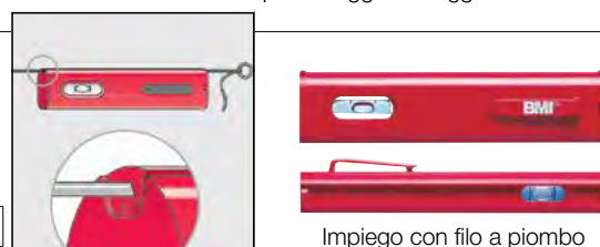
Impiego con filo a piombo